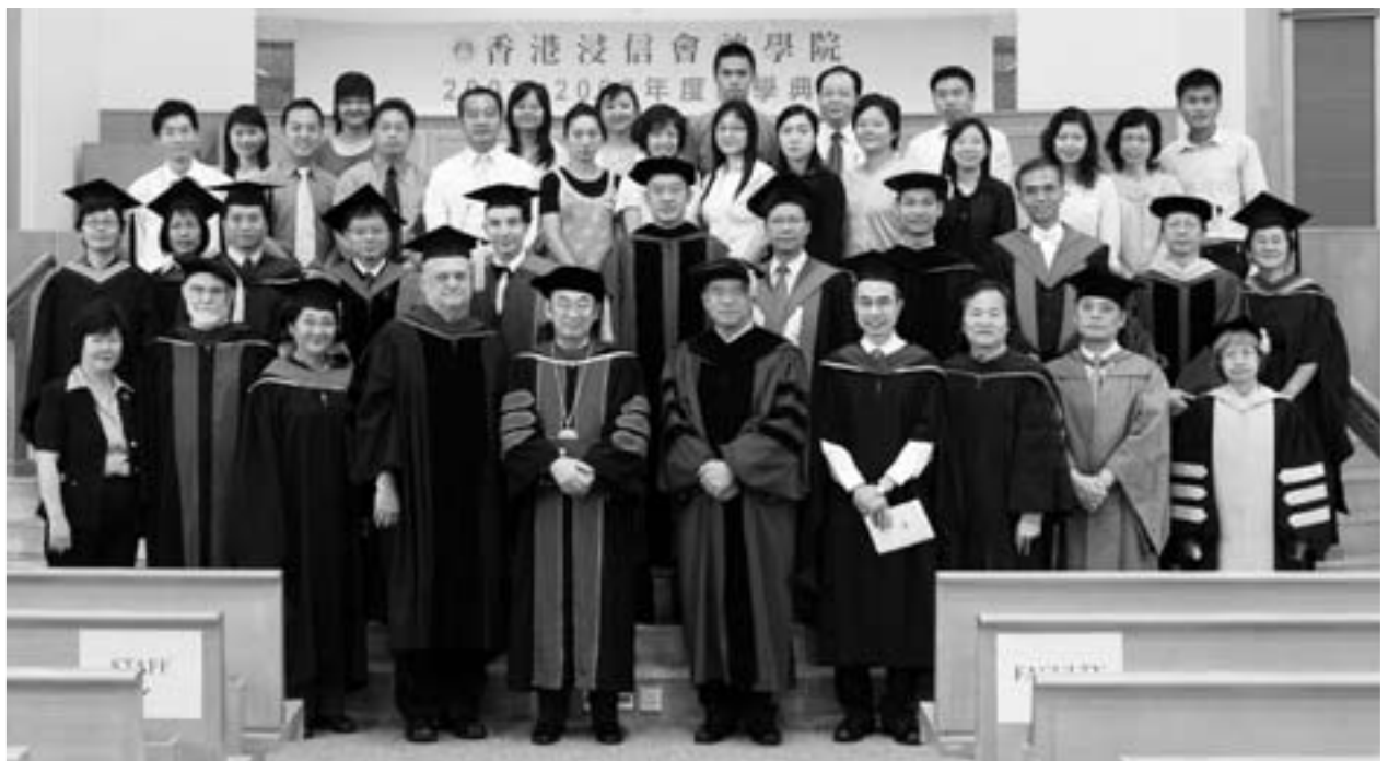
老師與新同學攝於開學典禮後