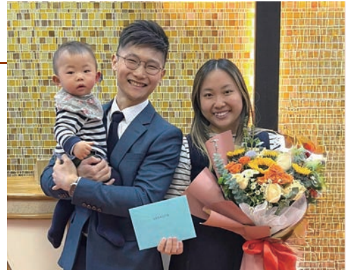
肇倫與太太及兒子

這幾年的學習十分寶貴，拓寬了我的「選擇空間」……讓我能夠更忠實地詮釋上主的話語。